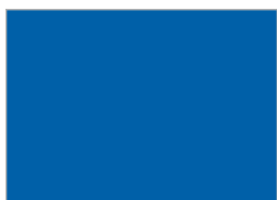
11. ストロングブルー (#0060A8)