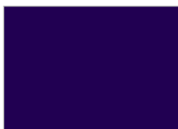
12. ナイトスカイ (#210052)