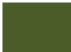
14. オリーブグリーン (#4C5C29)