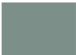
6. アクエリアス (#7C9089)