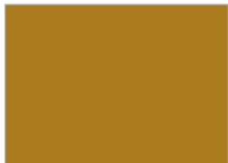
1. ゴールデンオーカー (#AA7B1C)