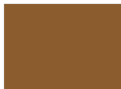
9. コーヒー (#8A5C2E)