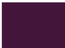
13. ナイトスカイ (#44153B)